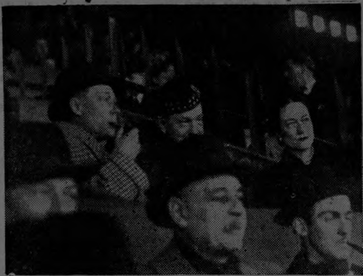
El Duque y la Duquesa de Windsor se encuentran actualmente en París y, últimamente, asistieron en el Parque de los Príncipes de la Ciudad, a un match de rugby, franco-inglés.