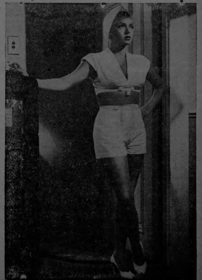
Conjunto para baños de mar y de sol, muy apropiado para estos últimos días de verano.